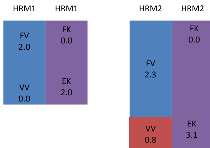
Diagramm Bilanzumstellung HRM2